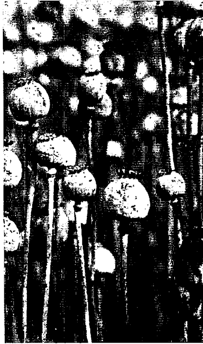
Geç Tunç Çağı'nda Ege'de yaygın olarak yetiştirilen haşhaşın, Anadolu'da Ortaçağ öncesi yetiştirilmediği bilinmiyor.

Tarihi dönemlerle ilgili araştırma yapan arkeologların, ihtiyaç duydukları bütün bilgilere, buldukları yazılı kaynaklarla ulaştıklarını düşünme eğilimleri vardır.